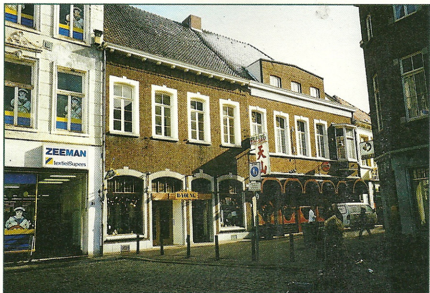
Het voormalig Commandantshuis in 1999. Na de splitsing in 1871 werd het linkerdeel uiteindelijk een kledingzaak en het rechterdeel een restaurant.

Mocht het zover komen dat het Commandantshuis inderdaad gerestaureerd wordt, dan kan het één van de pronkstukken van de Markt worden en de stad een forse toeristische impuls geven. Bavo Crombach komt er dan niet onderuit alsnog een extra deeltje uit te brengen in zijn reeks 'Grote Monumenten in Roermond'.