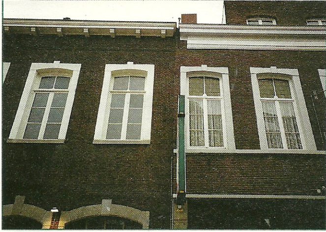
Minieme verschillen in de raampartijen van linker en rechter pand.