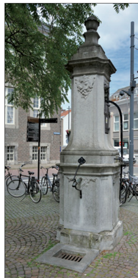
Nepomuk-pomp op het Munsterplein