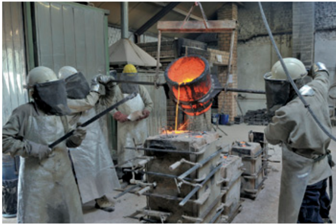
Brons in mal met meeuw gieten