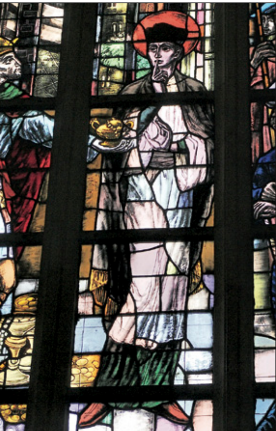
Nepomuk, glas in loodraam in de Kathedraal. Glas in lood is van Max Weiss

In de rest van onze regio vertoont de heilige zich niet zoveel in het openbaar. Van de straat af gezien is hij nog wel te ontdekken in Thorn (kapel en