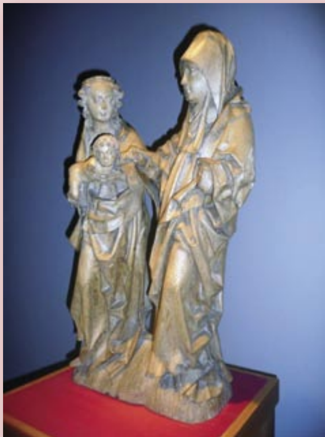
Een 'Annatrīts' van de Meester van Elsloo. Te zien in het Bonnefanten museum te Maastricht.

Natuurlijk, een gelukkige archiefvondst die zou bevestigen dat vader en zoon van Ool wel degelijk de meesters zijn van dit productieve atelier, verandert de zaak volledig. Maar het is hier echt zoeken naar een naald in een hooiberg. Vandaar mijn pleidooi om daar niet op te wachten en de noodnaamwijziging te verbinden met de tentoonstelling die aanstaande is. Het valt zeer te betwijfelen of, indien dit zorgvuldig