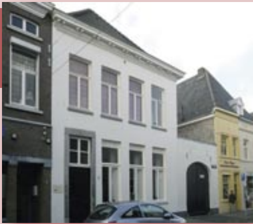
De poort die toegang geeft tot de voormalige Begijnengats met de twee belendende panden: Minderbroedersstraat 2 en Neerstraat 82/80a. Als Jan van Ool de anonieme meester is die nu de meester van Elsloo genoemd wordt, dan heeft deze meester in een van beide panden gewoond en gewerkt.

gebeurt, de internationale kunst- en museumwereld in verwarring raakt. Op dit gebied is wel vaker sprake van voortschrijdend inzicht door wetenschappelijk onderzoek en/of gelukkige ontdekkingen.